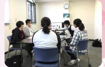
車椅子の特徴について説明をしています。